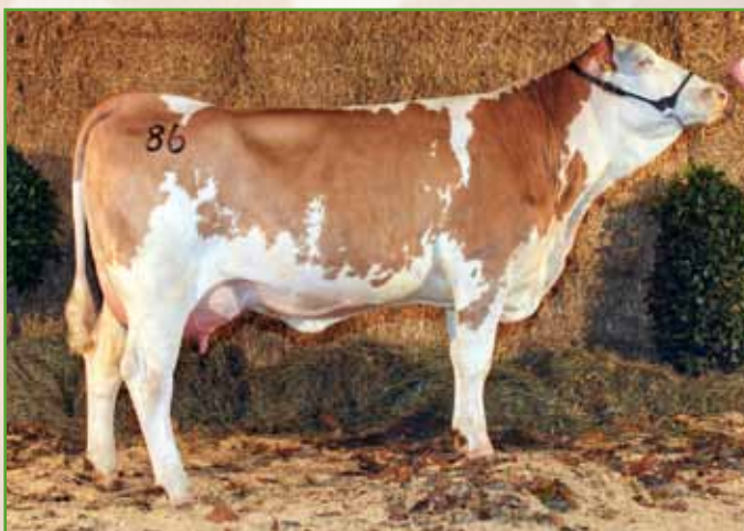
INDER-Tochter FLIEDER – Mutter von Katalognummer 181

Die Mutter FLIEDER machte bei den INDER-Nachzuchtschauen sowohl in Amstetten als auch in Greinbach durch ihr exzellentes Euter und ihr gutes Fundament auf sich aufmerksam. Derzeit ist sie in der vierten Laktation und präsentiert sich noch immer als hervorragende und problemlose Laufstallkuh. FREIFRAU, eine MANDL-Tochter aus FLIEDER, welche auf einem sehr guten Zuchtbetrieb in der Steiermark steht, präsentierte sich bei der Bezirksschau in Friedberg bestens und erreichte einen Gruppenreservesieg. Die Jungkalbin FREUDE zeigt bei den Genomzuchtwerten ihre Stärken im MW mit 130, ein Plus von 13 Punkten, und im Euter mit 114. Hervorragende Euter mit höchster Leistungsbereitschaft sind die Attribute, die diese Kuhlinie vereinen.