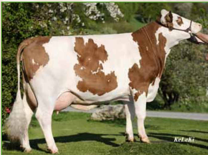
HADES-Tochter INES – Mutter von Katalognummer 183

Vater GS WILHELM, Muttervater HADES, Großvater WINNIPEG – Stiere, die in den letzten Jahren sowie derzeit in der Fleckviehzucht äußerst bedeutend sind, sind in diesem sehr eleganten Jungrind vereint. Neben dem hervorragenden GZW sind auch die Exterieur-Zuchtwerte und die Inhaltsstoffzuchtwerte weit überdurchschnittlich. Aus diesem I-Kuhstamm vom Züchter Radler, Gramastetten, gibt es bereits mehrere wertvolle Zuchttiere. Von Großmutter IDA stammt der HADES-Sohn HERMANN, der aktuell 134 gGZW hat, sowie der Stier RAAB, ein ROUND-UP-Sohn mit 125 gGZW. Die Urgroßmutter hat einen WINNIPEG-Sohn mit 138 gGZW, von dem die ersten Töchter in Milch sind.