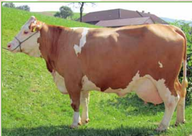
Die P-Kuhfamilie des Betriebes Kerschner wird seit Generationen im NÖ-Zuchtprogramm genutzt. Die Mutter der Embryonen, PIANO, ist eine DEXTRO-Tochter aus dem Prüfeinsatz.