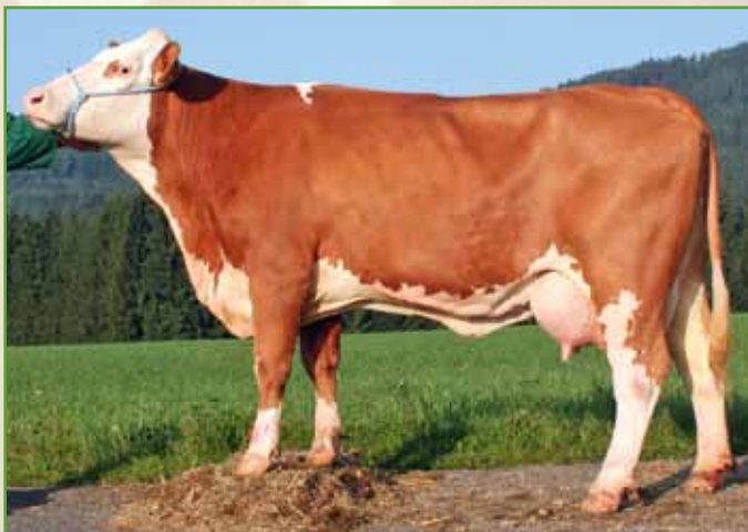
RAJA – Mutter des Stieres VANDAL (Foto in der 2. Lakt.)

Jungstier VANDAL stammt aus einer sehr euterstarken Kuhfamilie vom Zuchtbetrieb Fürst aus Lasberg, was sich auch im Euterzuchtwert und in den Einzelzuchtwerten für das Euter widerspiegelt. Besonders herausragend sind auch die Fitnesswerte, vor allem der Kalbeverlauf sowie die Nutzungsdauer, die sich gegenüber dem Ahnenindex deutlich verbessert haben. VANDAL ist damit einer der komplettesten GS VANDOR-Söhne.