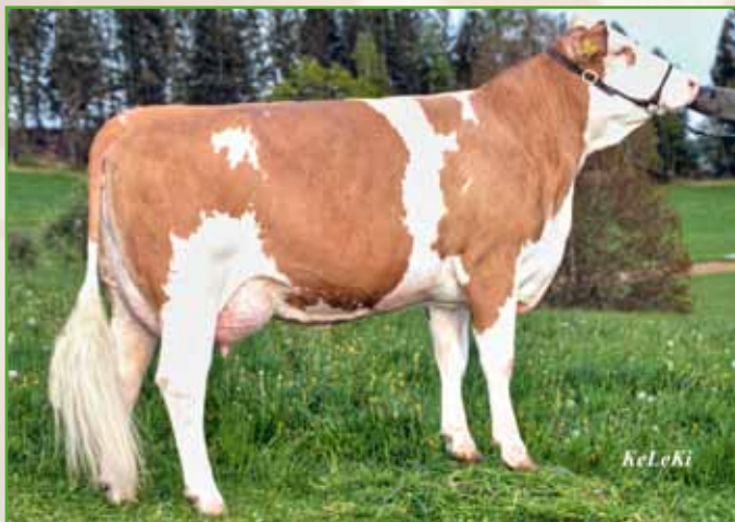
NERA, Mutter von Katalog-Nr. 186

Die MANITOBA-Tochter NELSA stammt aus der Stiermutter NERA (V: ROMEL), einer erfolgreichen Ausstellungskuh. Eine Vollschwester von NELSA ist ebenso Stiermutter im Zuchtprogramm Fleckvieh Austria und Mutter eines der interessantesten genomisch geprüften ILION-Söhne (Nummer 4 der ILION-Söhne mit gGZW 134). Belegt ist NELSA mit dem INDER-Sohn INDOSSAR, der als genomischer Jungstier in gezielter Paarung eingesetzt wird.