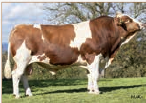
GS MALIK (Ista x Manitoba)

ISTA ist eine der bemerkenswertesten und erfolgreichsten Stiermütter in Niederösterreich. Die Nachkommen der I-Kuhfamilie geben in der ausgezeichneten und bekannten Fleckviehherde des Betriebes Scharner den Ton an. Die züchterische Bilanz von ISTA als Stiermutter ist makellos. Zwei Söhne von ihr wurden von GENOSTAR angekauft und beide schafften den Sprung zum positiv geprüften Vererber. Ihr Sohn GS VERSETTO (V: Vagabund) ist einer der leistungsstärksten Vererber bei Fleckvieh und GS MALIK (V: Manitoba) liefert kompakte, unkomplizierte Töchter. Richtig stolz ist die Familie Scharner auf ihre ISTA, da sie die magische Grenze von 100.000 kg-Lebensleistung überschritten hat.