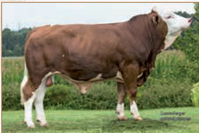
MOZARELLA , ein genomischer Jungvererber aus der Z-Kuhlinie der Familie Lichtenegger, Wolfsberg, Kärnten

Die Z-Kuhlinie der Familie Lichtenegger wurde von der 100.000 l-Kuh ZENZI, einer RANDY-Tochter, begründet. ZITA , eine direkte WINNIPEG-Tochter aus dieser Stammkuh, schaffte durch ihre hervorragende Vererbungskraft die Basis für die züchterische Bearbeitung dieses Kuhstammes.