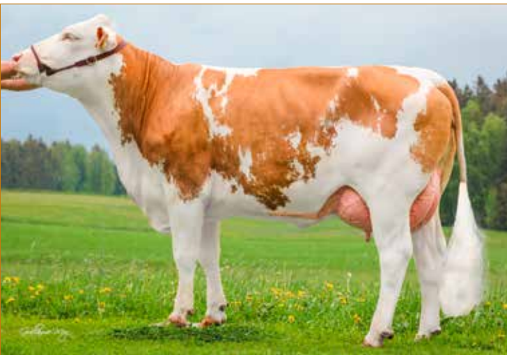
GS WOIWODE-Tochter SILKE