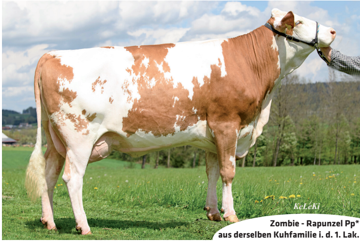
KeLeKi Zombie - Rapunzel Pp* aus derselben Kuhfamilie i. d. 1. Lak.