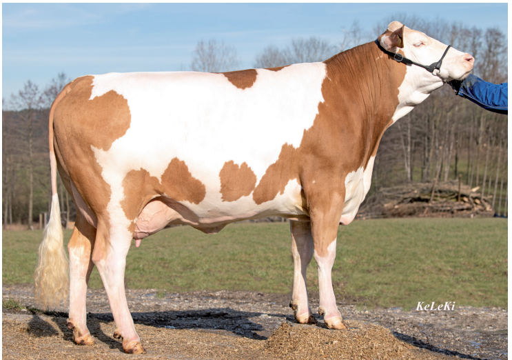
Manolo Pp* - Rosabella Pp* (aus derselben Kuhfamilie i. d. 1. Lak.)

Es ist den Züchtern von NEMO ein Anliegen, immer wieder mit Linienalternativen züchterisch zu arbeiten. Dieser Grundeinstellung ist es zu verdanken, dass mit NEMO der beste Neptun-Sohn mit einem GZW von 141 angeboten werden kann.