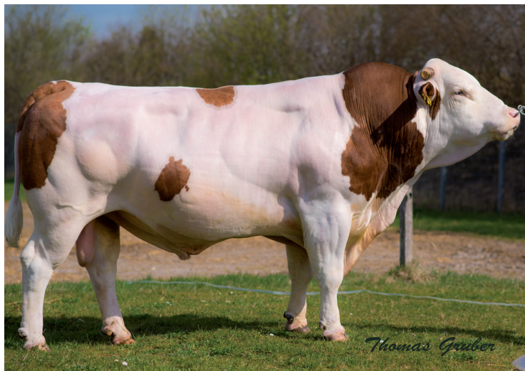
Muttervater Votary P*S

Obwohl IGNAZ PP* genetisch reinerbig hornlos ist, zählt er mit einem GZW von 136 zu den besten Söhnen von Immunity P*S. IGNAZ PP* zeigt ein sehr ausgeglichenes Vererbungsprofil. Sein hoher MW von 127 ist vor allem auch auf die überdurchschnittlichen Inhaltsstoffe zurückzuführen. Mit einem Kalbeverlauf paternal von 112 ist er auch für den Einsatz auf Kalbinnen geeignet.