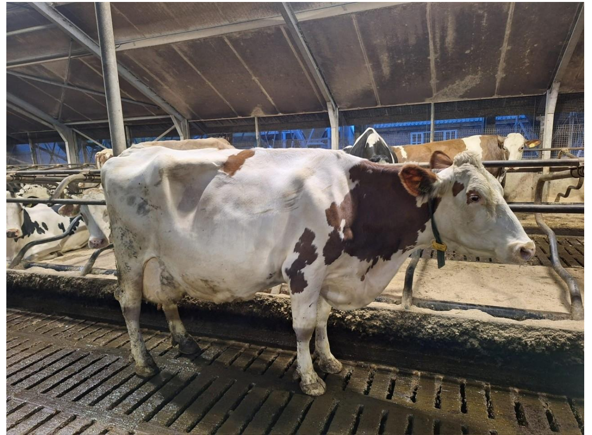
Rinie 618 (GS Rumgo x HF)