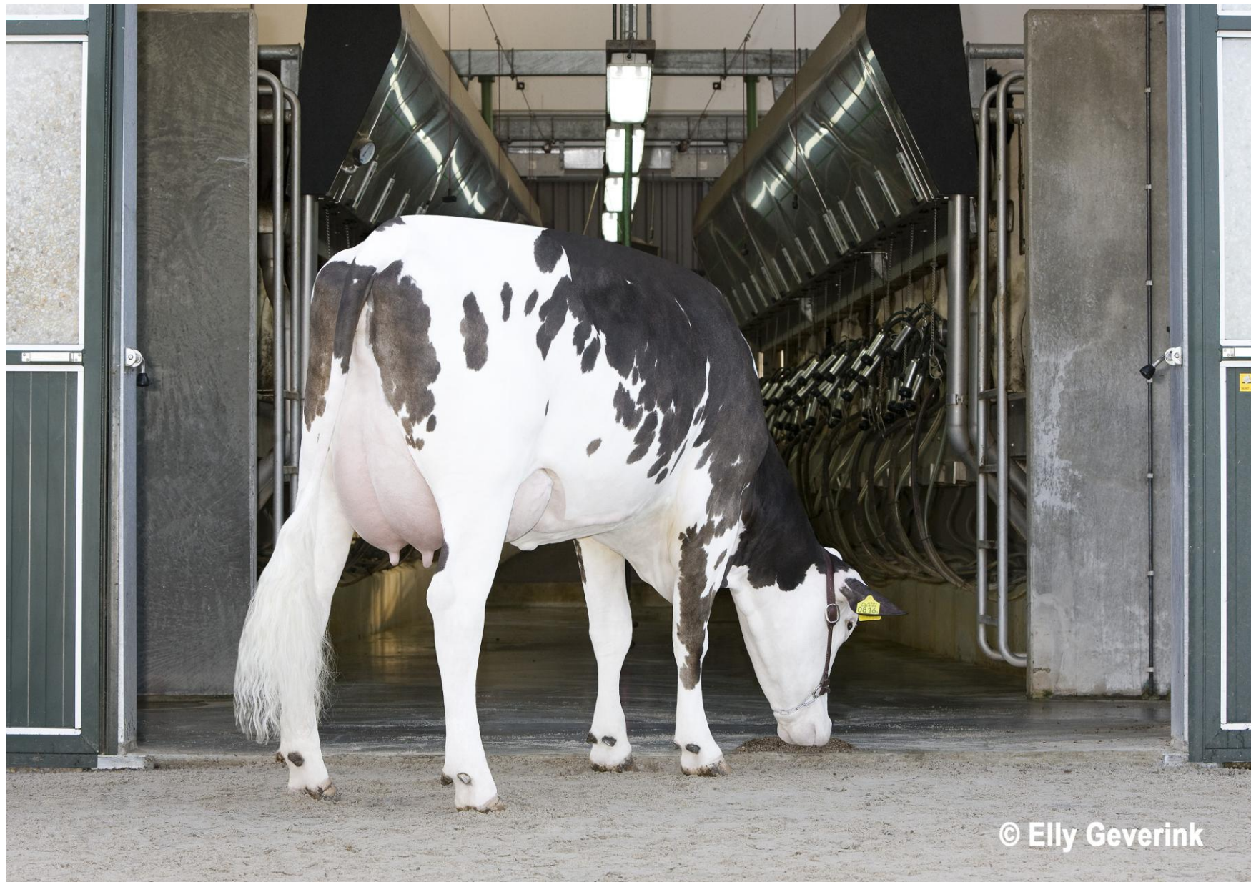
Rau (FLV x HF)